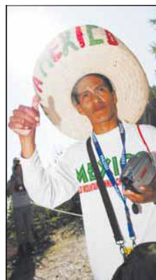
... ou air mexicain. HOFMANN

Juniors dames: 1. Australie, 4 points; 2. Etats-Unis, 12; 3. Turquie, 13; 4. Angleterre, 17; 5. Ecosse, 19; puis: 16. Suisse, 80.